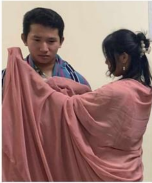
Mary, wife of Cleophas