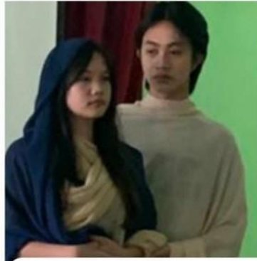
Mary, Mother of Jesus