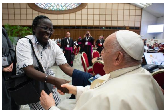
Le Pape salue toute la Famille Calvarienne