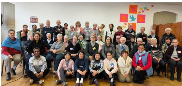
Groupe de Gramat