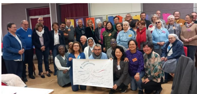
Groupe de Bourg-la-Reine.