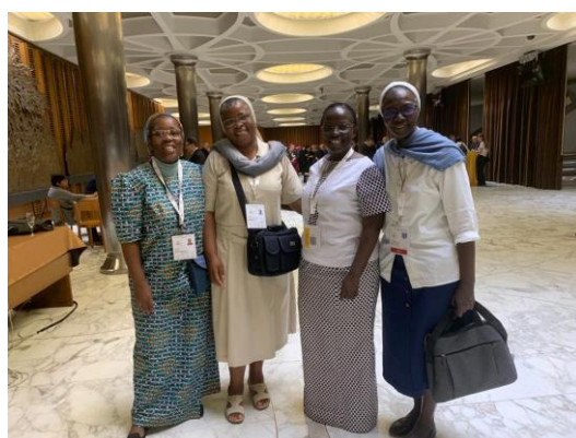
Les théologiennes africaines