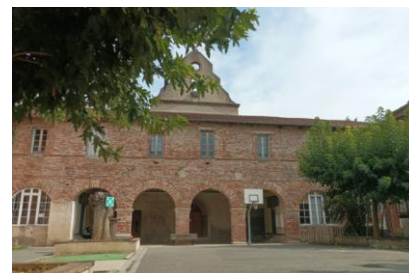
Site de la Verrerie