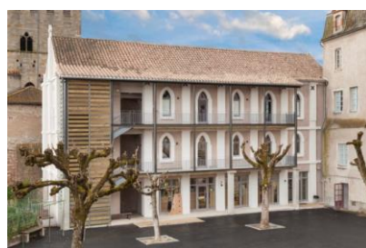
Site des Soubirous