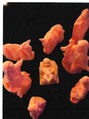
Crèche en 3D