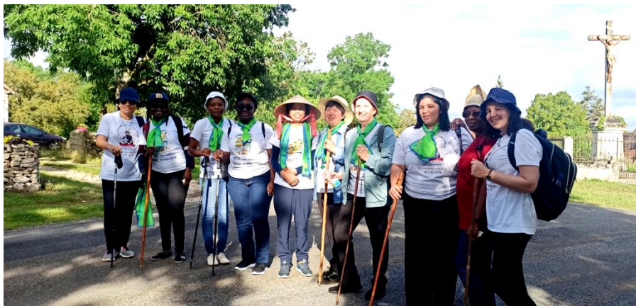
En pèlerinage vers Rocamadour