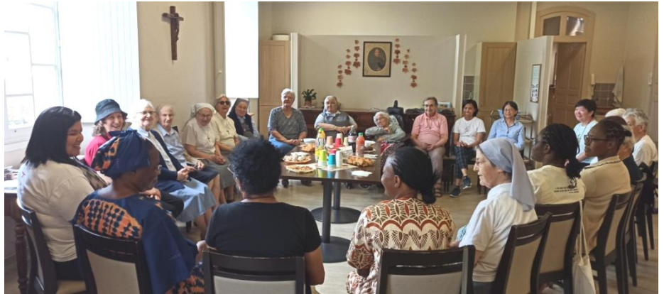
Rencontre avec la communauté de la Maison-Mère